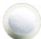
Cubierto con tela