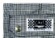
Pata de Gallo / Houn's Tooth