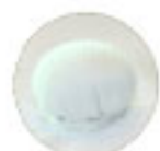
Enrollado a mano

Cuando ordene, agregue el código de la talla al artículo XS, S, M, L, XL, 2X, 3X, 4X, 5X. Ejemplo: J009-XL